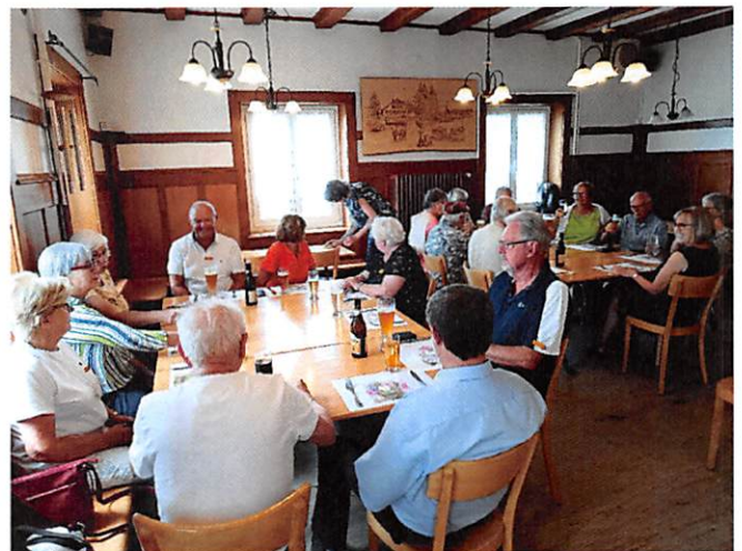
Mittagessen im Restaurant Untergrenchenberg