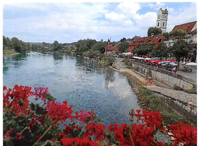
Büren an der Aare